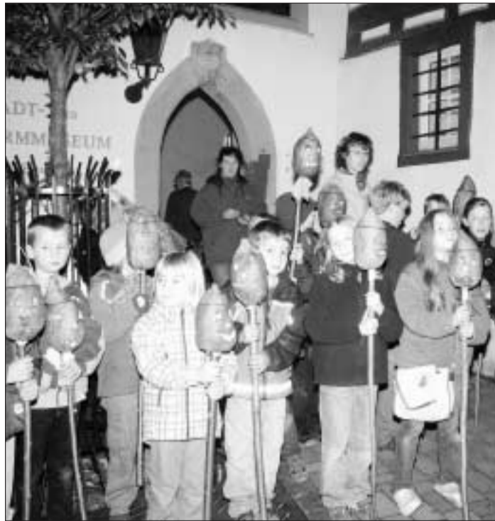
Singend, und mit ihren Rüben zogen die Kinder durch die Altstadt von Bad Camberg.

SCHWICKERSHAUSEN (dag). Die Mitglieder des Schwicki-Theater werden eine kreative Pause einlegen und haben sich entschlossen in diesem Jahr kein Stück aufzuführen. Gleichzeitig wurde aber beschlossen, im nächsten Jahr zum gewohnten Termin am 13. und 14. November 2010, die nächste Aufführung zu präsentieren. Und damit auch nichts schief geht, wird bereits Ende diesen Jahres mit der Stückauswahl begonnen. Wer Interesse hat, mitzuspielen kann sich an Kerstin Hafener, Telefon 06434/5812 oder Carola Voigtländer, Telefon 06434/38265 wenden.