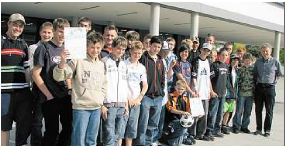
Die Riedelbacher MPS nahm am Wettbewerb „Jugend trainiert für Olympia“ teil und siegte beim Kreiseinscheid in Stierstadt.