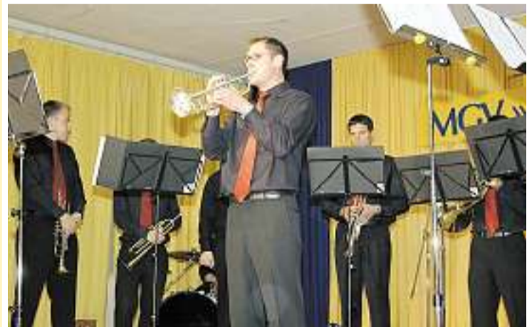
Perfekte Intonation und mitreißende Arrangements begeisterten das Publikum.